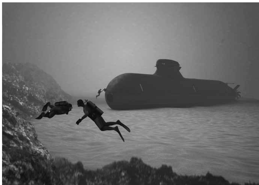
Artist impression av Nästa Generations Ubåt.

många dotterföretag i olika delar av världen, med andra ord en bred kundkontakt och därmed en förmåga att hantera höga och skilda kravställningar. Men även för den erkänt höga kvaliteten på Saabs produkter.