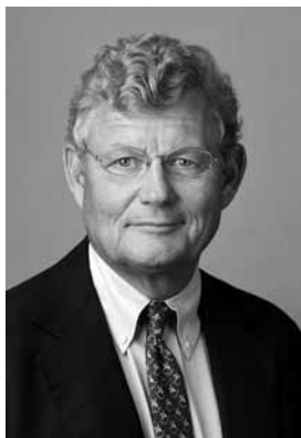
Ledamoten JACOB WALLENBERG

Jacob Wallenberg är ordförande i Investor AB. Han är även reservofficer i flottan.