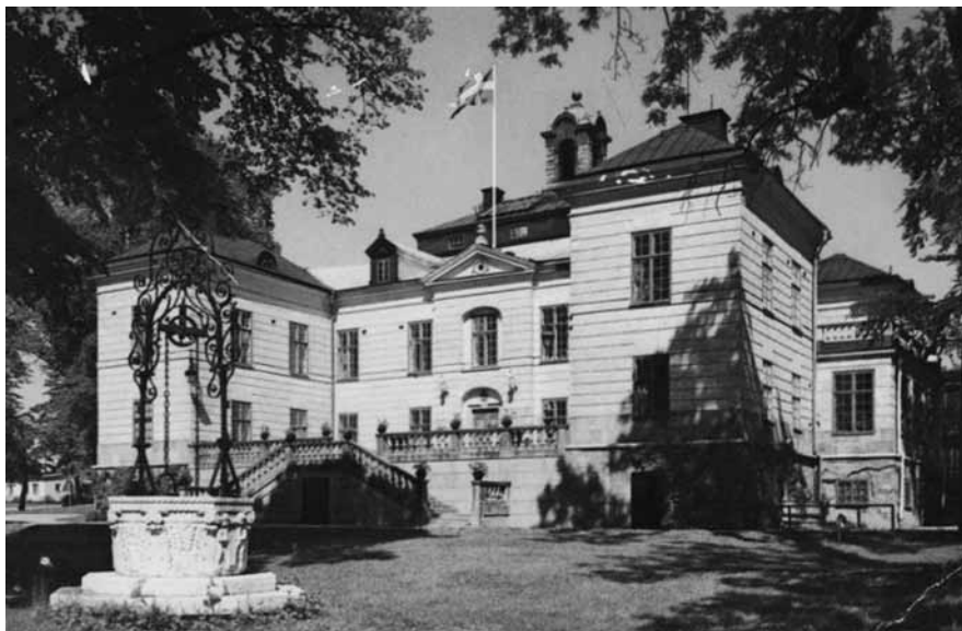
Kungl. Sjökrigsskolan i Näsbypark.

så studiemotiverade, en grupp som utgör en växande grupp av långtidsarbetslösa.