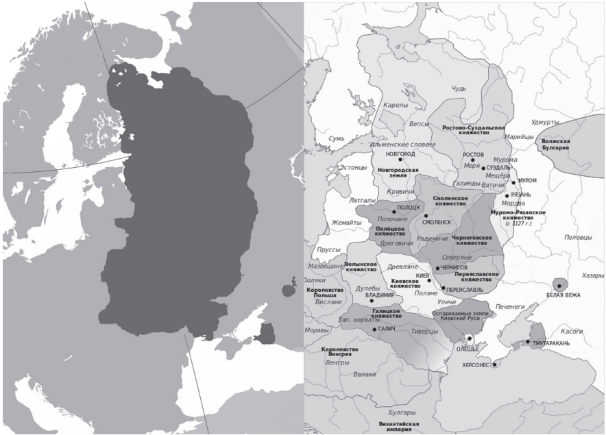
Kiev-riket år 862 till mitten av 1100-talet Det uppdelade Kiev-riket. Karta över Rus år 1054—1132.

Mongolerna kom till vår del av världen år 1237 och Kiev erövrades år 1240. Gyllene Hordens välde i Europa upphörde slutligen helt i början av 1500-talet varvid det nuvarande ukrainska området i stor utsträckning kom under polskt välde. Polackerna var dock inga populära herrar för det ukrainska folket vilket ledde till att från och med 1591 ett flertal kosackuppror mot polackerna genomfördes. Kulmen på denna upprorsvåg kom 1648 då kosacken Bohdan Chmelnytskyj ledde upproret. Han tog kontroll över större delen av Ukraina. Väl medveten om att polackerna inte skulle ge upp det ukrainska territoriet så lätt insåg Chmelnytskyj att de behövde en allierad för att över tid kunna stå emot Polen. Han vände sig därför till Moskva och ställde sig under Moskva furstens beskydd år 1654. Ukraina kom därigenom in i den moskovitiska/ryska intressesfären. Denna överenskommelse om beskydd av Moskva skulle visa sig vara ett för Ukraina historiskt och fatalt strategiskt misstag.